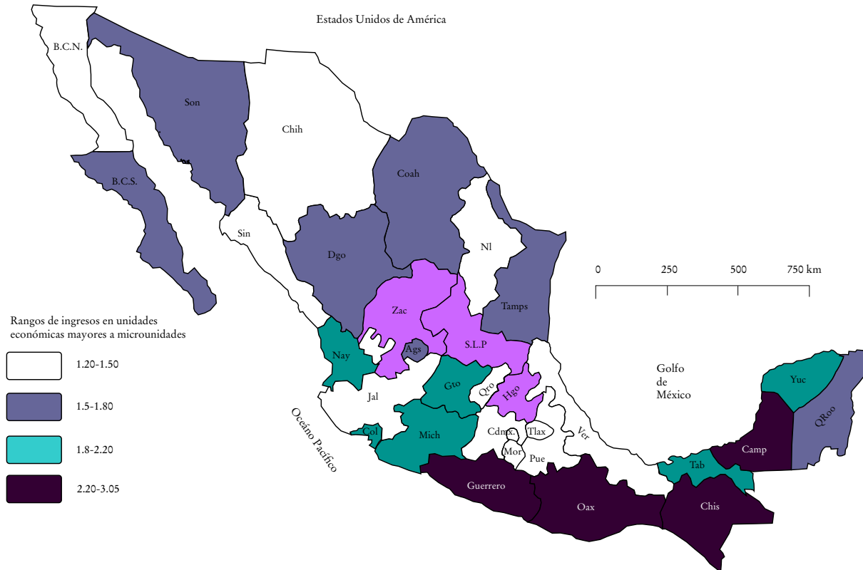
MAPA 2. Razón entre ingreso de unidades mayores y microunidades, 2020